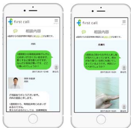
チャットで気軽に相談