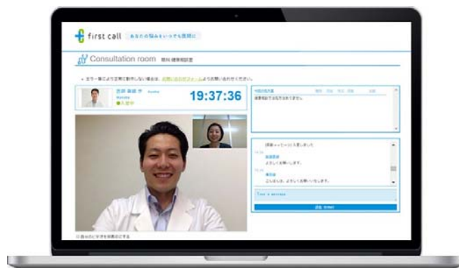
テレビ電話でじっくり相談